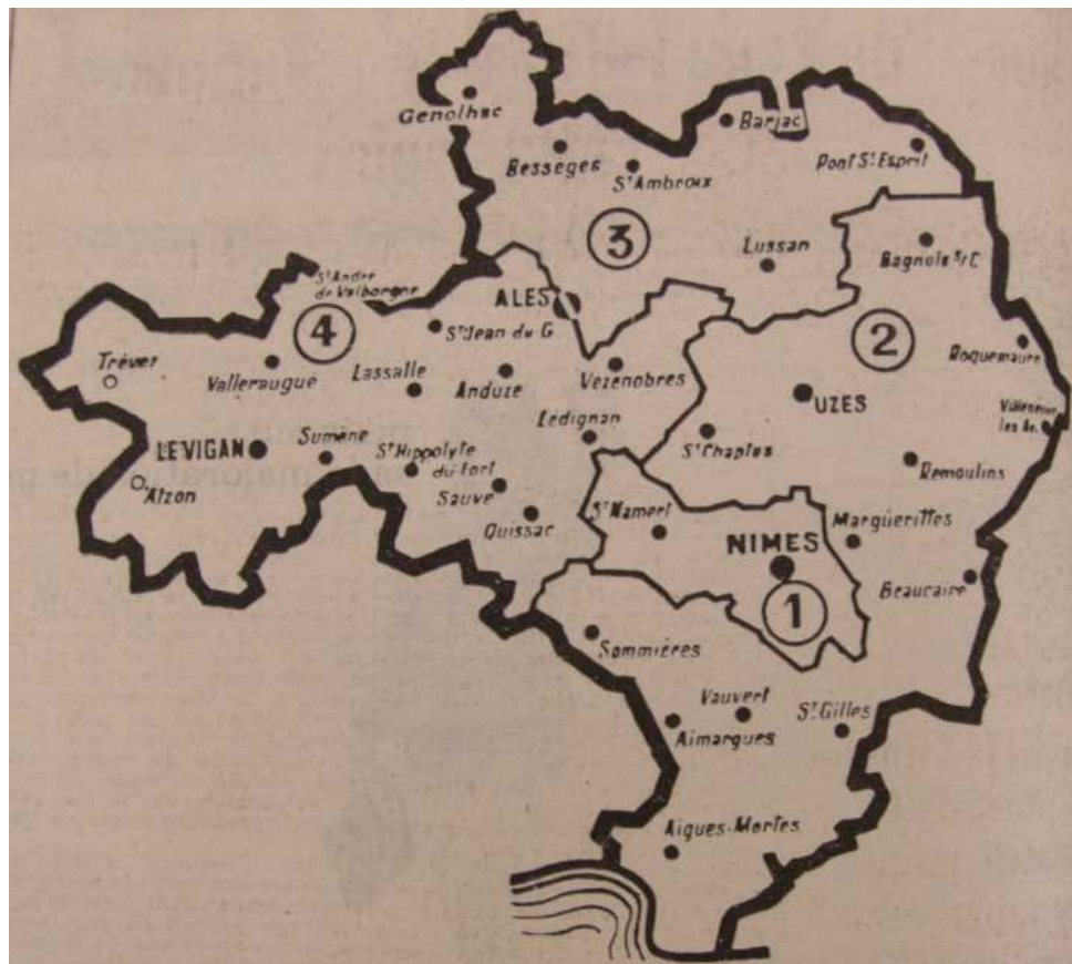
Carte des quatre circonscriptions du Gard en 1962